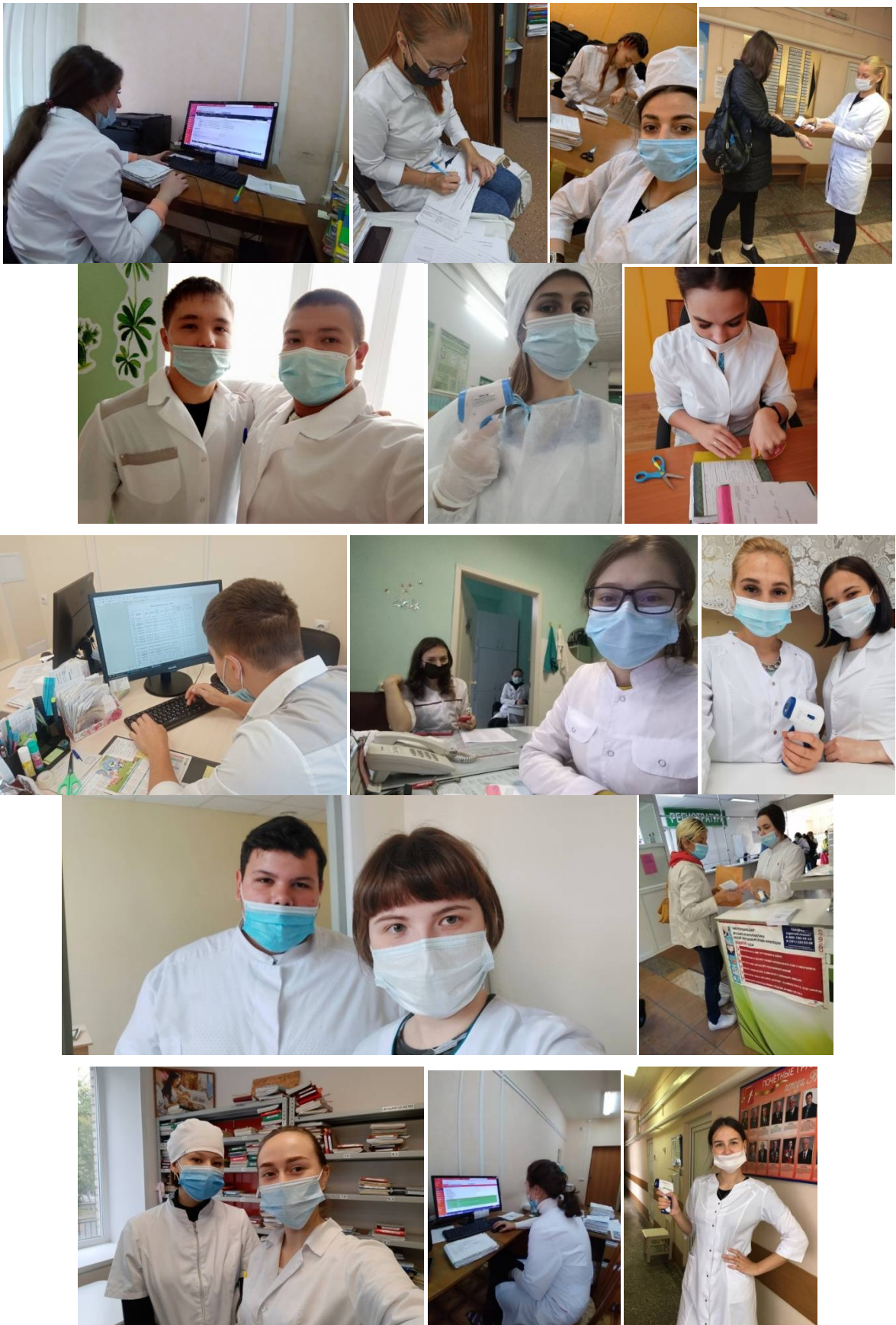
Студенты – медики приняли участие в мероприятиях в рамках Всемирного дня безопасности пациентов